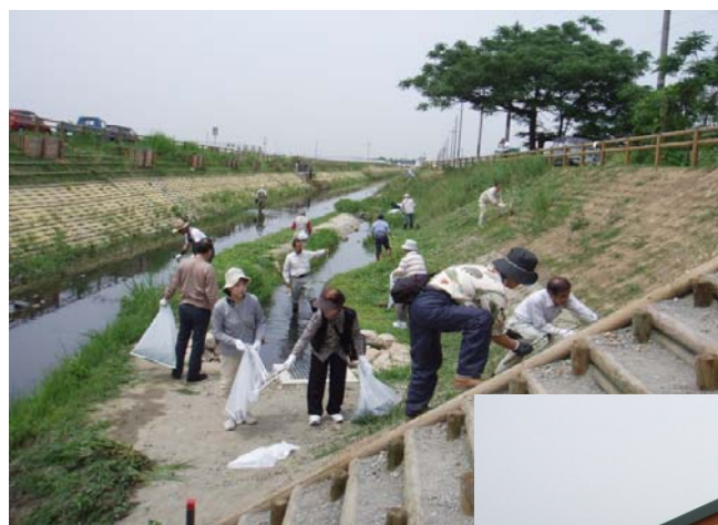
← 月1回の草刈やゴミ収集などの清掃作業