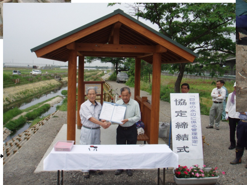
協定締結式の様子→