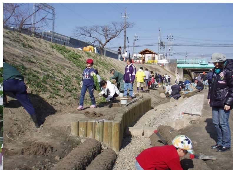
↑ スイセン、準絶滅危惧種ヤガミスゲなどの移植作業