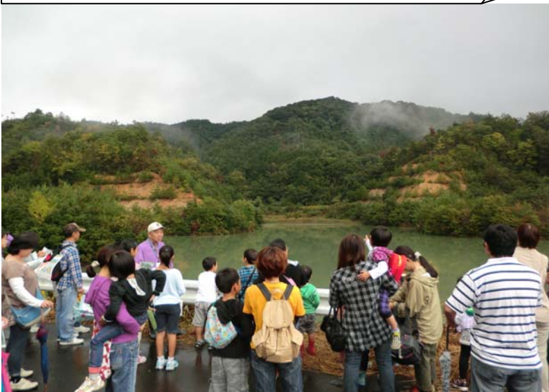
降った雨をここに溜め、ポンプで国営の畑団地に送るんだよ。

畑で農作物を育てるには、たくさんの水が必要です。その大切な水を効率よく利用しなければなりません。土地改良区では大切な水源施設として管理しています。