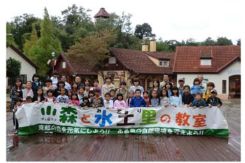
参加者みんなで記念撮影