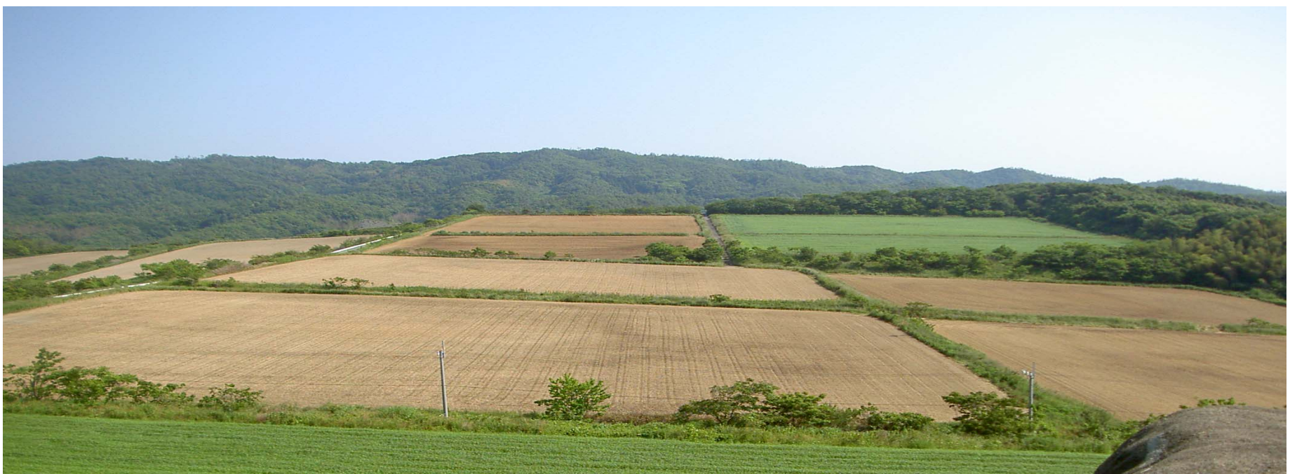
国営団地の一部全景