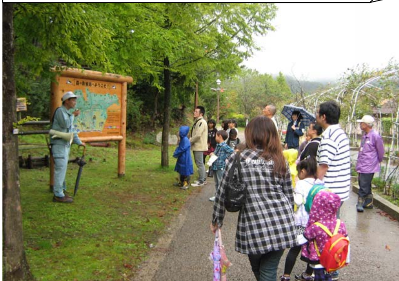
森林は色んなことで私たちの生活を支えているんです。みんなは、森に何が住んでいるのか知っていますか？

森林や田畑は、木材や食べ物をつくるだけではありません。土砂の流失を防いだり、さまざまな生き物が住んでいます。