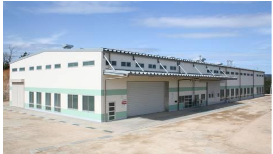
平成22年には製茶工場が建設されました