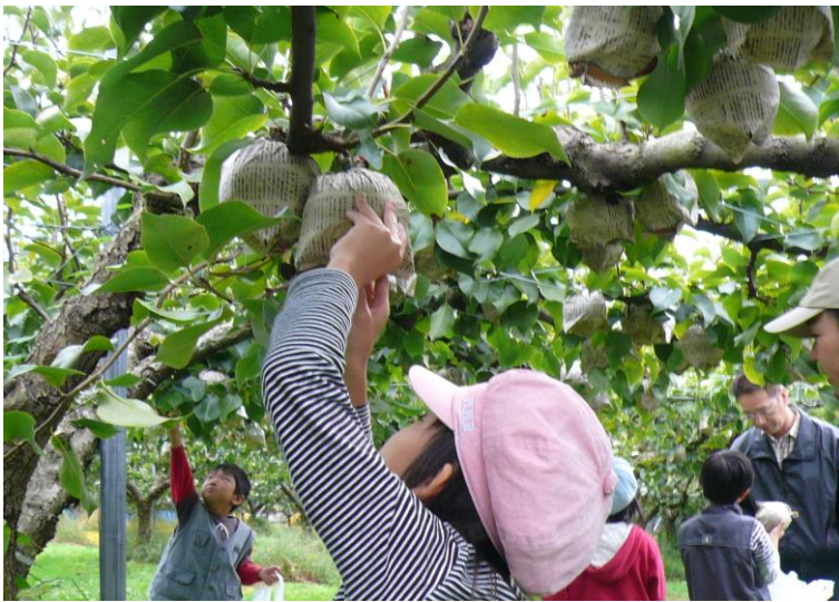
京たngo梨の収穫体験の様子です

平成16年から「お茶」の栽培が始まり、抹茶の原料や丹後産茶として市場出荷がされています。また「京たngo茶」としてペットボトルでも販売されています!